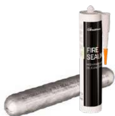
FIRE SEALING стр. 122 -124