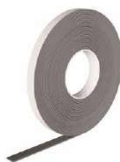
FIRE STRIPE стр. 130