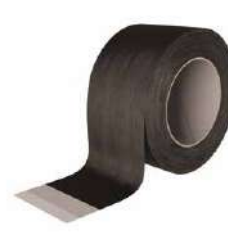
FRONT BAND UV 210 стр. 98